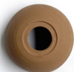
Terracota natural Natural terracotta Terre cuite naturelle

Natural or glazed terracotta ceramic lampshade colours Couleurs de l'abat-jour en céramique en terre cuite naturelle ou émaillée