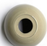
Beige esmaltado Glazed beige Beige émaillée