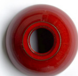
Rojo esmaltado Glazed red Rouge émaillée