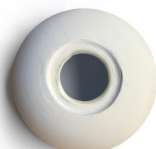
Blanco mate natural Natural matt white Blanc mat naturel