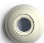
Blanco esmaltado Glazed white Blanc émaillée