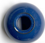
Azul esmaltado Glazed blue Bleu émaillée