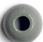
Gris esmaltado Glazed grey Gris émaillée