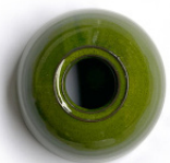
Verde esmaltado Glazed green Verte émaillée