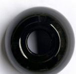
Negro esmaltado Glazed black Noir émaillée